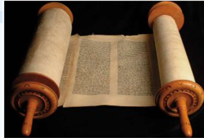
妥拉 先知書 聖錄